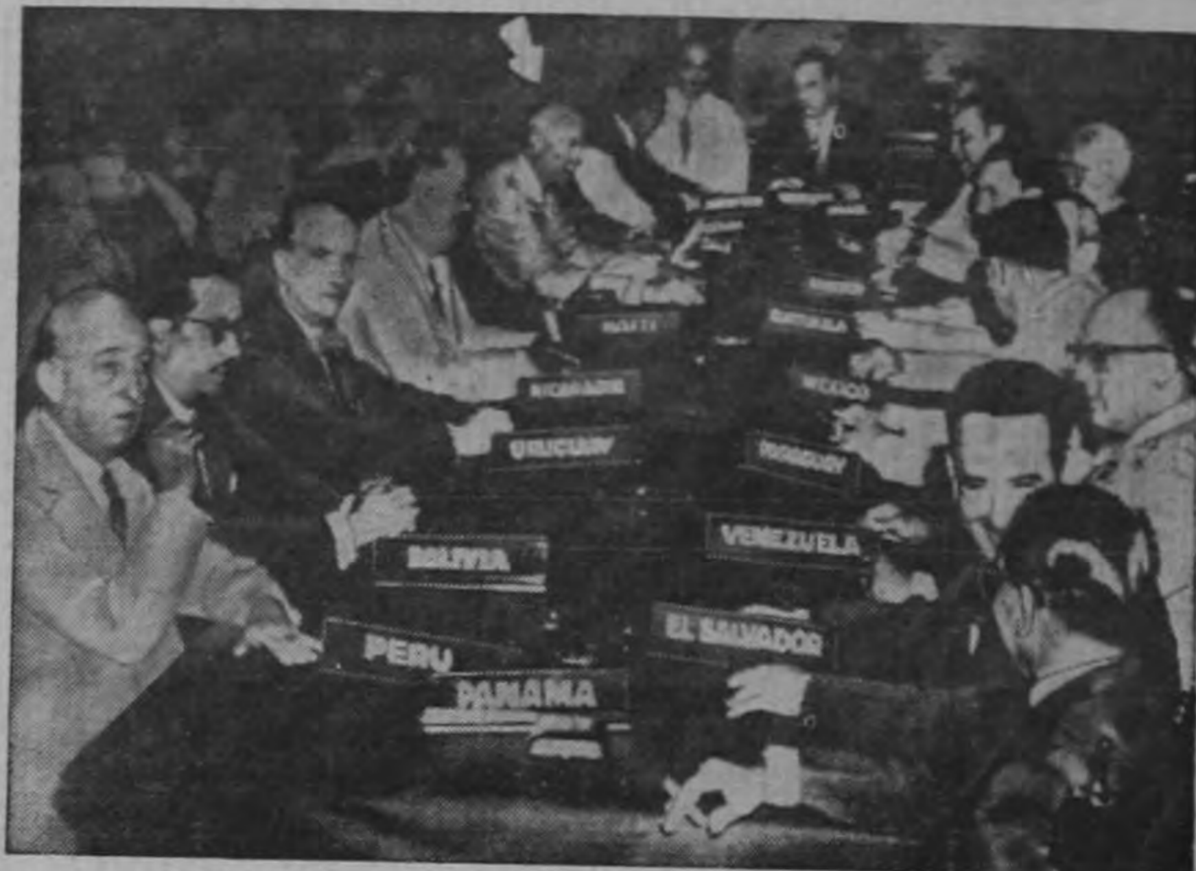
La foto muestra (flecha) al Presidente Eisenhower en la mesa de conferencia de los jefes de estado de las repúblicas americanas, en Ciudad Panamá. Dieciocho naciones latinoamericanas estuvieron representadas en la reunión de líderes del hemisferio occidental para propiciar la solidaridad. Desde la izquierda, siguiendo el movimiento del reloj en torno a la mesa se ven: Manuel Prado, presidente electo del Perú; Hernán Siles Suazo, presidente electo de Bolivia; Alberto Zubiria; Presidente de Uruguay; General Anastasio Somoza, presidente de Nicaragua; General Paul Magloire, de Haití, el Presidente Eisenhower; General Carlos Ibañez del Campo, presidente de Chile; José Figueres Ferrer, presidente de COSTA RICA; el presidente provisional de Argentina Pedro Aramburu; Presidente del Brasil; General Fulgencio Batista, presidente de Cuba; el Presidente saliente de Ecuador, José María Velasco Ibarra; Coronel Carlos Castillo Armas, presidente de Guatemala; Presidente Adolfo Ruiz Cortines, de México; General Alfredo Stroessner, de Paraguay; General Marcos Pérez Jiménez, de Venezuela; Presidente electo de El Salvador, José María Lemus y Presidente electo de Panamá, Ernesto de la Guardia, hijo que tomará posesión en octubre