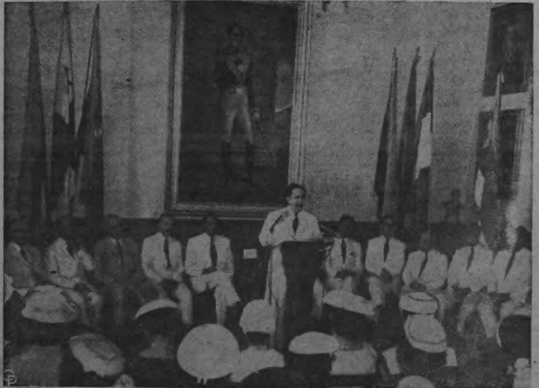
Por primera vez en la historia, los presidentes de las naciones americanas se preparan a reunirse en Ciudad Panamá, Panamá. La reunión se a los Embajadores de las 21 repúblicas congregada para el pasado junio, fue aplazada por la enfermedad del Presidente Eisenhower. En la foto