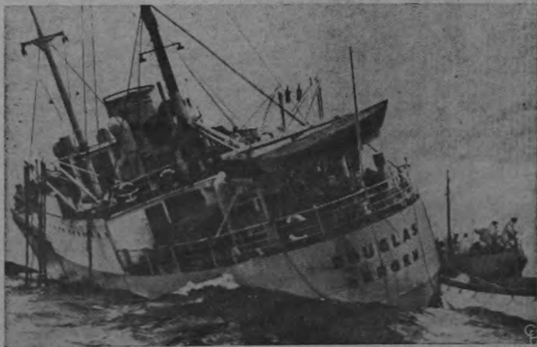
Tres mujeres y dos niños pasajeros del bar-ta está encallada en The Maidens, cerca del cono noruego Douglas son trasladados a un bote de rescate de Antrim, en Irlanda del Norte. rescate mientras la nave batida por una tormenta