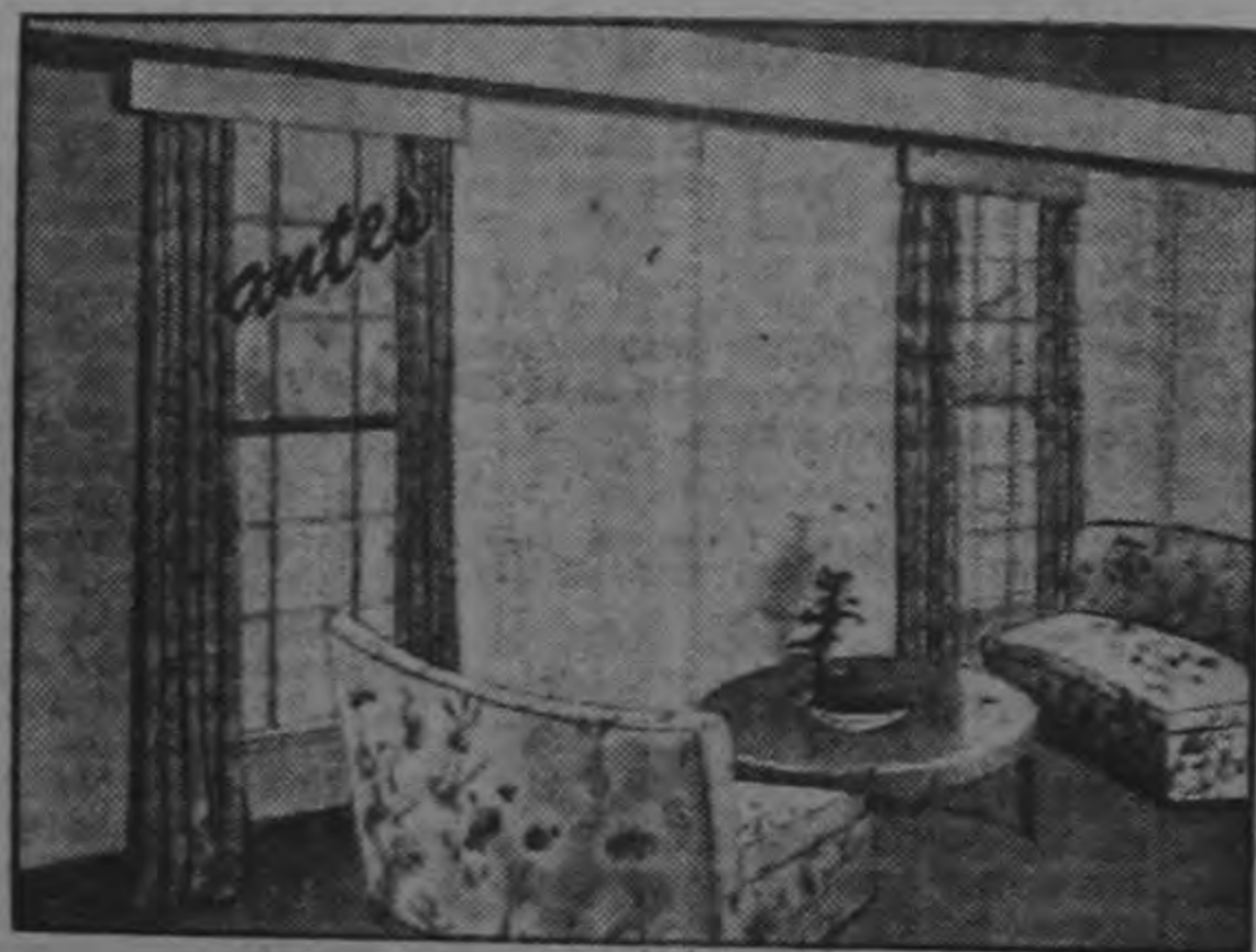
ANTES DE MODERNIZAR

Más luz y más aire es el lema de la construcción moderna y confortable.