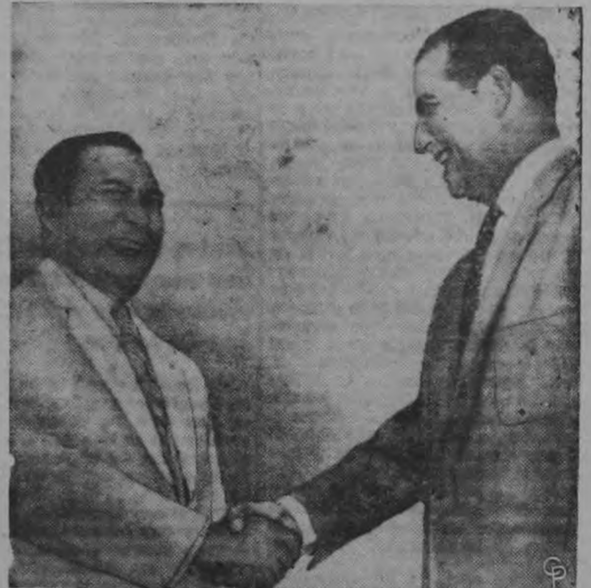
El Presidente Ricardo M. Arias (derecha) de Panamá recibe al Presidente Fulgencio Batista de Cuba a su llegada a Ciudad Panamá para la reunión de presidente americanos.