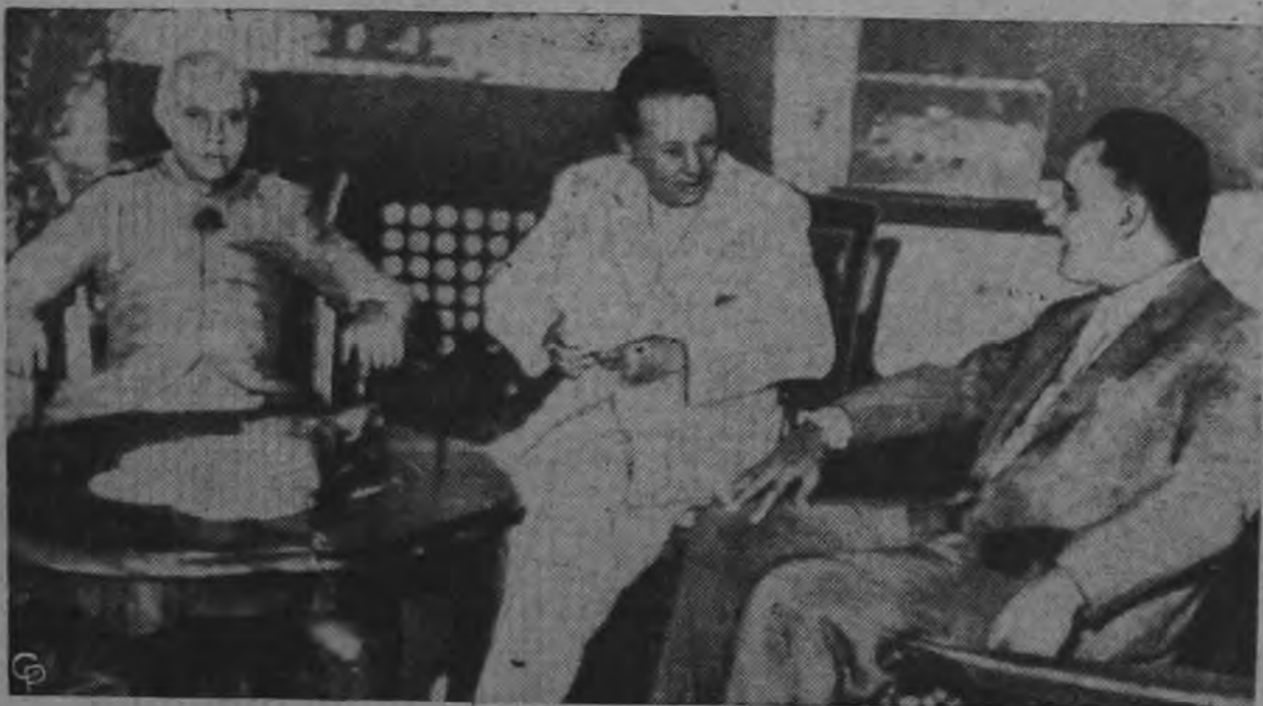
El Primer Ministro Jawaharlal Nehru de la Yugoslavia (centro). A la derecha se ve al Presidente India apareciendo reunido con los otros miembros de la conferencia de los Tres Grandes neutralistas para conferenciarlo que la conferencia fue una simple charla de a en Brioni, la villa de verano del Mariscal Tito demigós.