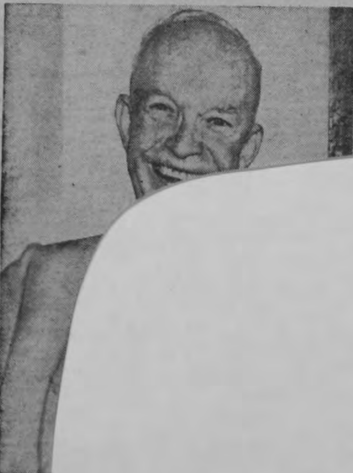
El Presidente Eisenhower al ser condecorado en Ciudad Panamá. Representante de las repúblicas americanas para llevar a cabo el programa de intercambio de cadetes.