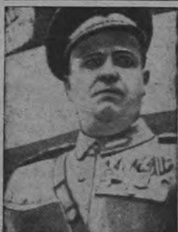
El General Mirlay Farkas, ex Ministro de Defensa de Hungría ha sido depuesto de su rango y expulsado del partido comunista. La acción se tomó por el Comité Central de los Obreros Húngaros durante una sesión en Budapest. El General Farkas fue acusado de perseguir a los "viejos" comunistas.

Los problemas de la paz son dos, fundamentalmente: la pobreza de nuestro pueblo, y la negación de la libertad.— Nuestra época dispone de conocimientos científicos que hacen posible la abundancia, pero esos conocimientos no se aplican todavía en nuestros países. De ahí viene el fermento social