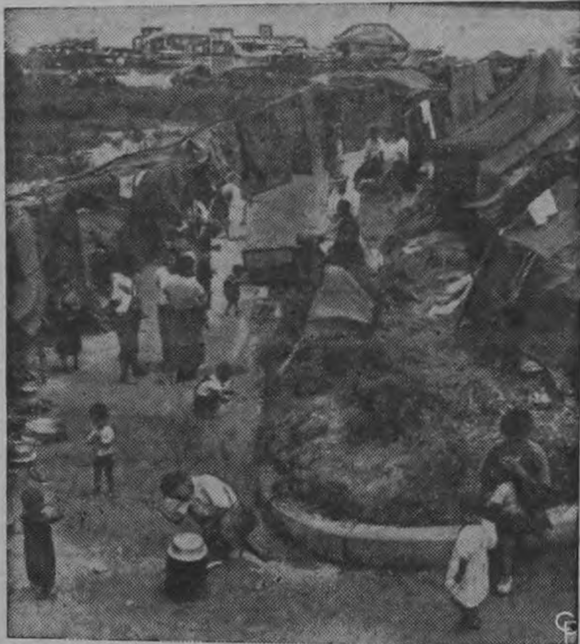
Echados de sus hogares por el desbordamiento del río Han, es los surcoreanos viven en refugios improvisados en terrenos altos de lo alrededores, de la zona inundada. Los daños a las cosechas han sido enormes.

Logre esta única oportunidad de comprar un excelente