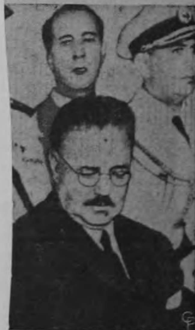
Magloire (izquierda) de Haití y otros líderes escuchan la lectura de la declaración en el salón donde se celebró la reunión.